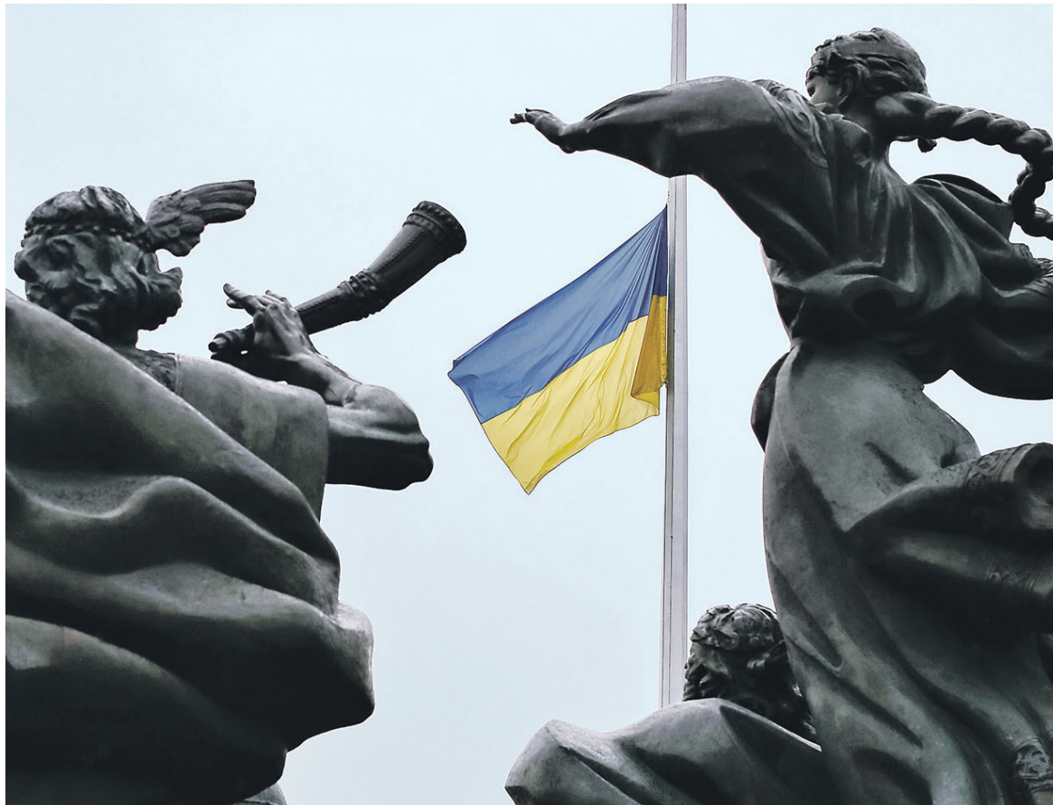
У Москвы нет необходимости в разрыве дипломатических отношений с Киевом, они и так фактически заморожены, отмечает эксперт

Поводом для последнего конфликта стали события 7–8 августа. В те дни, как сообщила в среду ФСБ России, в Крыму была раскрыта группа украинских диверсантов, готовившая теракты на полуострове. Силовики назвали задержанных сотрудниками главного управления разведки Минобороны Украины, в ходе перестрелки при их задержании погиб сотрудник ФСБ и военнотрудовой Минюста Украины, сообщила ФСБ. Украина причастность своих силовиков отрицает, а инцидент считает случайной перестрелкой между сотрудниками ФСБ и Минобороны. Президент России Владимир Путин после событий