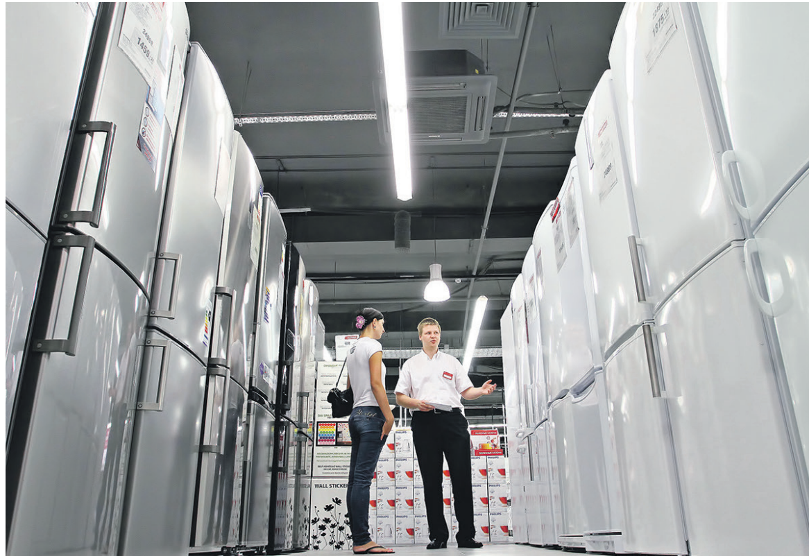
Евросоюз еще в октябре 2014 года запросил консультации с Россией по вопросу импортных пошлин на бумажную продукцию, холодильники и пальмовое масло

Евросоюз еще в октябре 2014 года запросил консультации с Россией по вопросу импортных