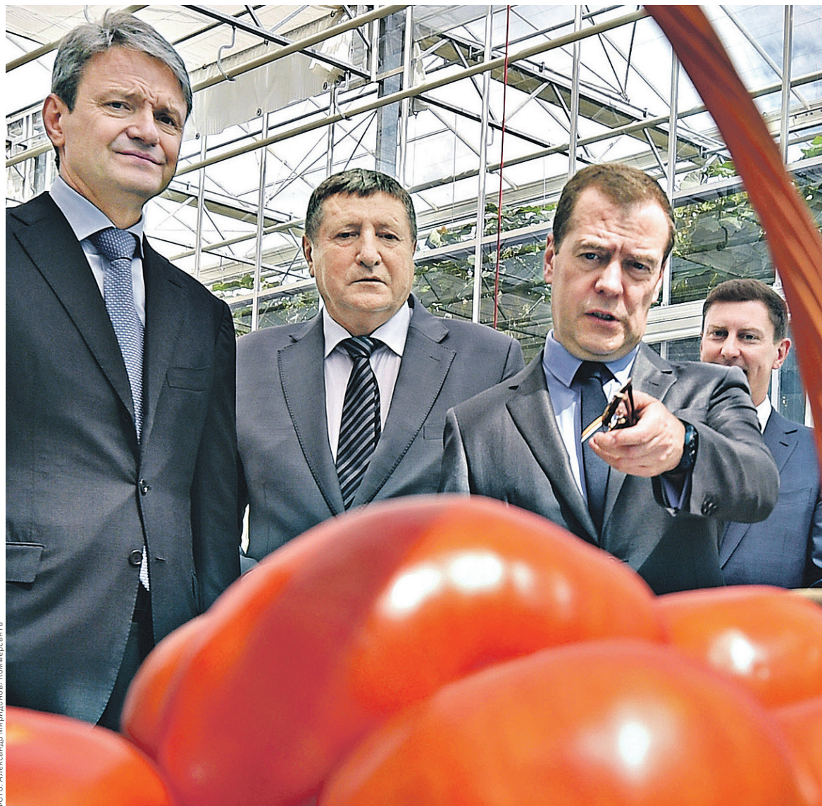
Возобновление импорта турецких помидоров может сильно ударить по российским тепличным комплексам. На фото: премьер-министр Дмитрий Медведев (справа) и глава Минсельхоза Александр Ткачев (слева) на подмосковном сельхозпредприятии, июль 2016 года

На этом фоне отечественное аграрное производство демонстрировало завидные темпы роста. По данным Минсельхоза,